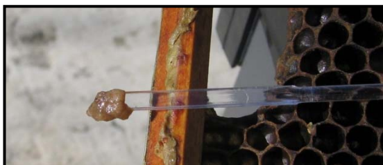
Larve di colore brunastro