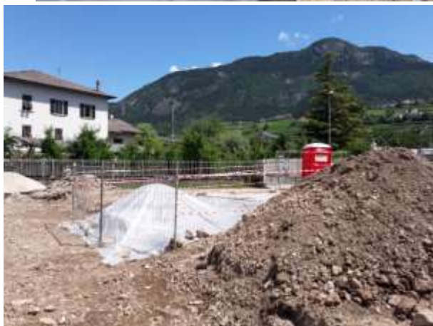
Opere di protezione del sito