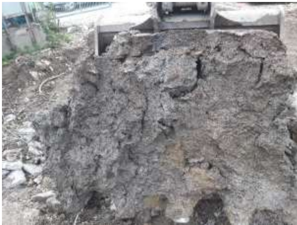
Terreno al di sotto della cisterna