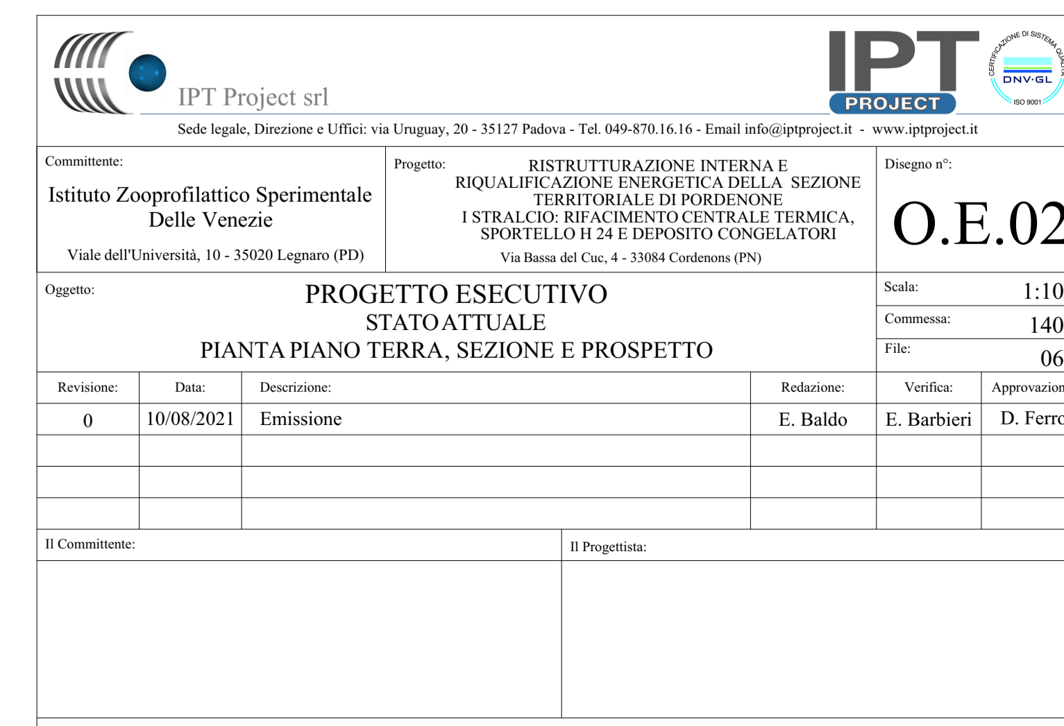
STRALCIO PROSPETTO SUD