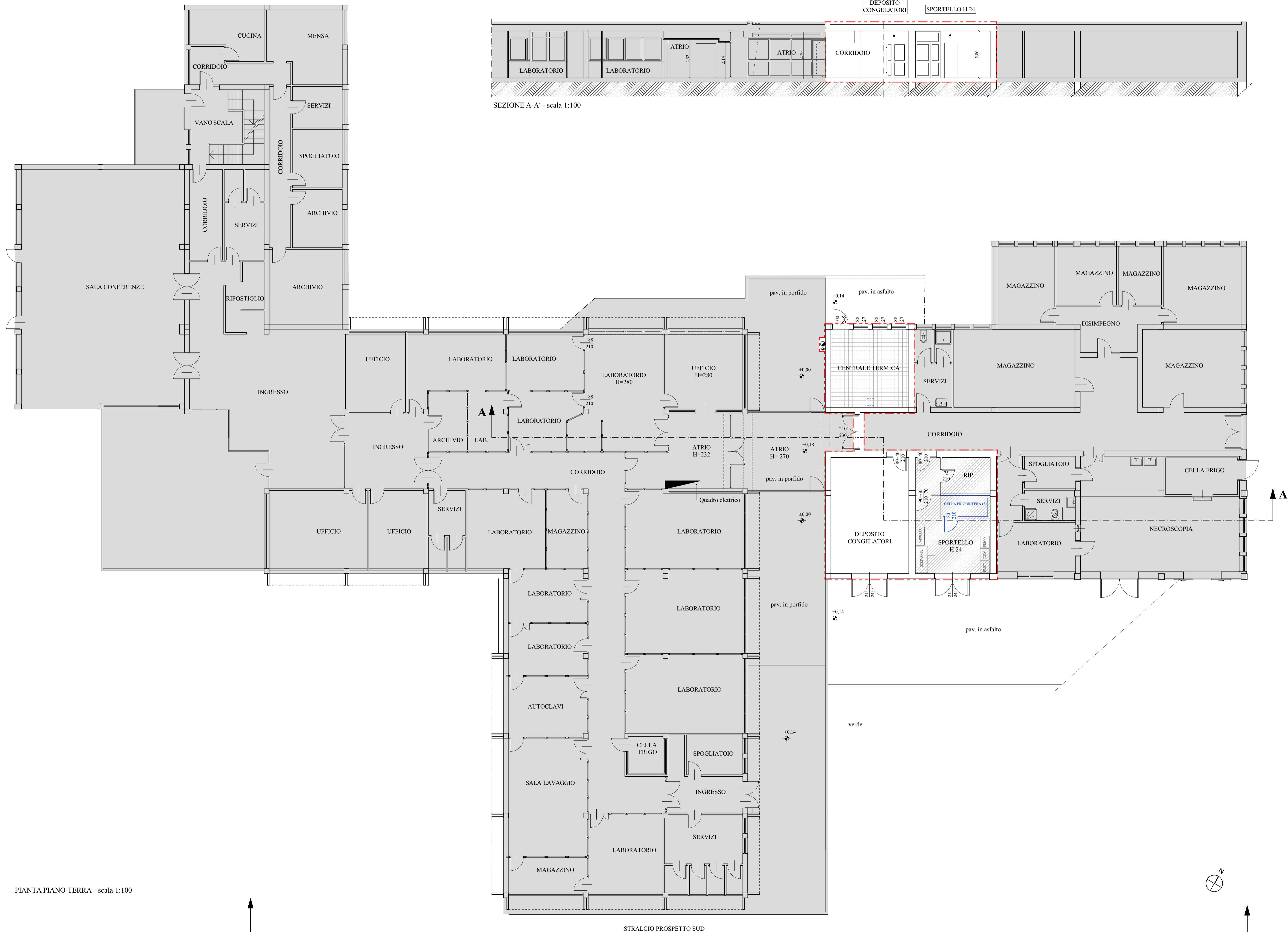
PIANTA PIANO TERRA - scala 1:100