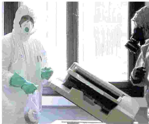
I vigili del fuoco del Nucleo Nbr in azione