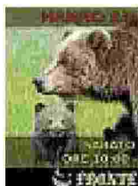
Sui social La protesta è stata annunciata sul web