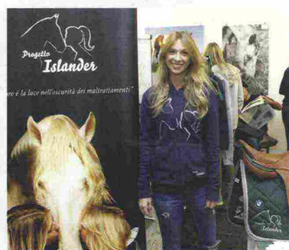
▶ Progetto Islander

Fieracavalli rappresenta anche un importante momento di formazione dedicato agli operatori del settore, quali circoli ippici, imprese locali,