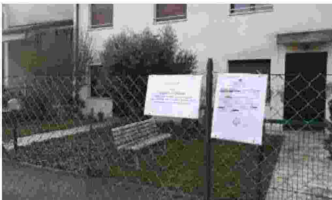
I cartelli con copia della denuncia ai carabinieri affissi all'abitazione