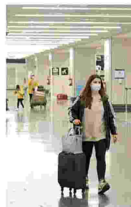
Un rientro da Londra (Ansa)

» I controlli hanno portato alla luce i casi di diversi viaggiatori di ritorno dal Regno Unito, rientrati in Italia prima che il governo mettesse in atto lo stop dei voli in entrata