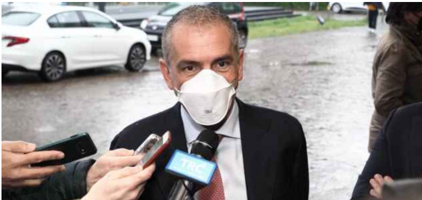
Andrea Costa, sottosegretario alla Salute

Non è da escludere una vaccinazione annuale contro il covid, così come spiegato stamane dal sottosegretario alla salute, Andrea Costa