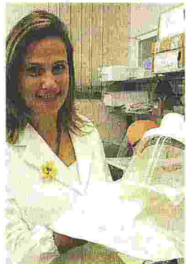
Nel 2005 Ilaria Capua all'Istituto zooprofilattico delle Venezie