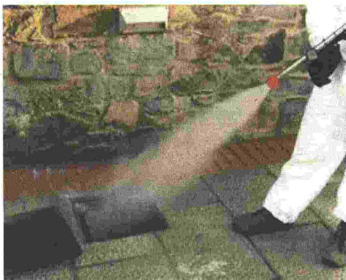
L'ORGANIZZAZIONE La disinfestazione messa in atto nelle ultime settimane per debellare la presenza delle zanzare culex pipiens