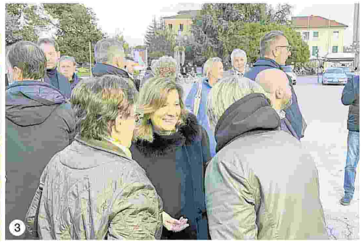
1) e 2) La ministra per le Riforme Istituzionali Elisabetta Casellati in Prato della Valle a I sapori d'Autunno incontra i commercianti 3) La ministra a colloquio con alcune cittadine arrivate in Prato per partecipare all'iniziativa

Ritaglio stampa ad uso esclusivo del destinatario, non riproducibile.