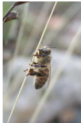
Api attaccate ai fili d'erba

Questa scheda è stata preparata per riconoscere i sintomi clinici della malattia nella colonia.