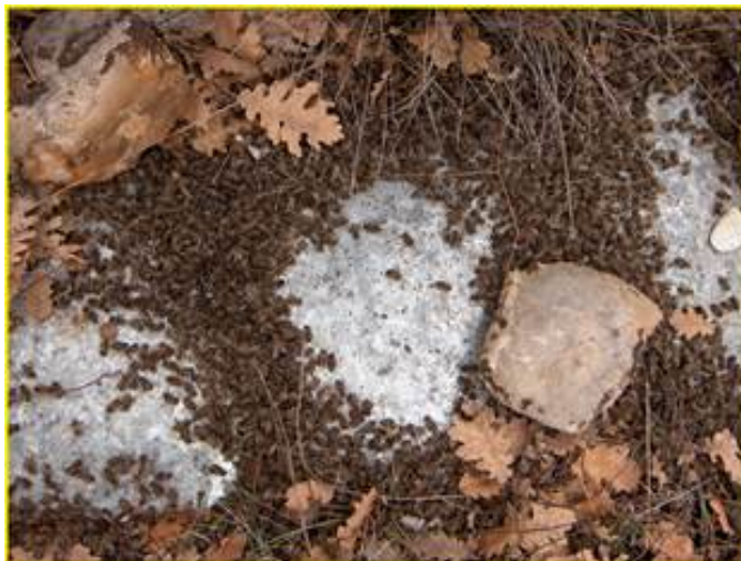
Api morte davanti all'alveare