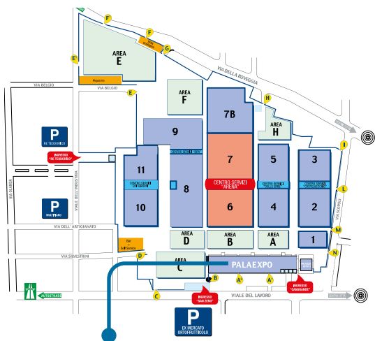
Centro Congressi PALAEXPO - Entrata A2